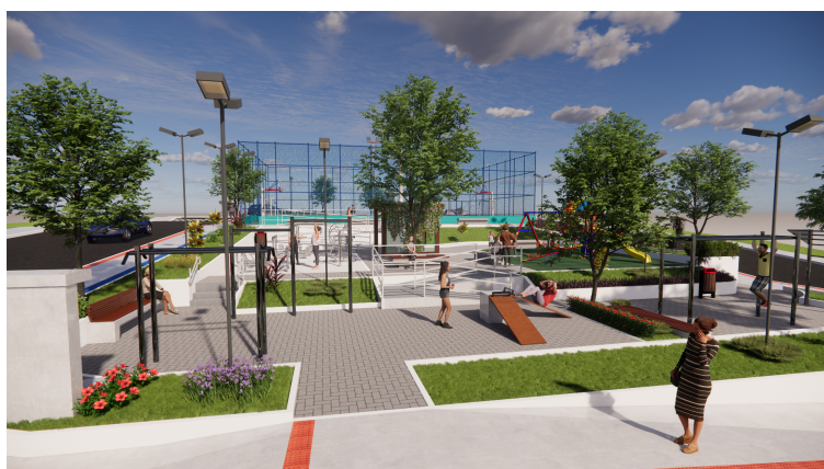
Vista aproximada da praça

Para garantir o cumprimento do cronograma da obra, a construtora deverá realizar o planejamento prévio das compras de materiais e contratação de serviços, de forma a