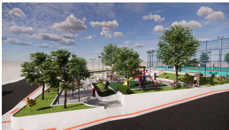
Vista aproximada da praça