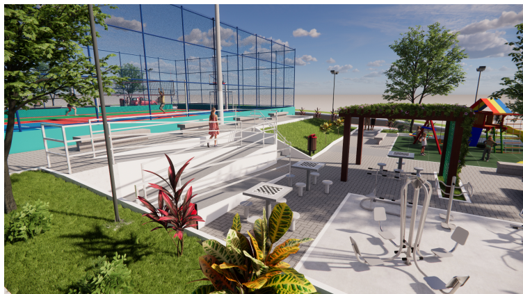
Vista aproximada da praça